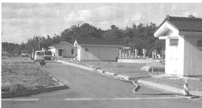
▲ 公共下水道処理場