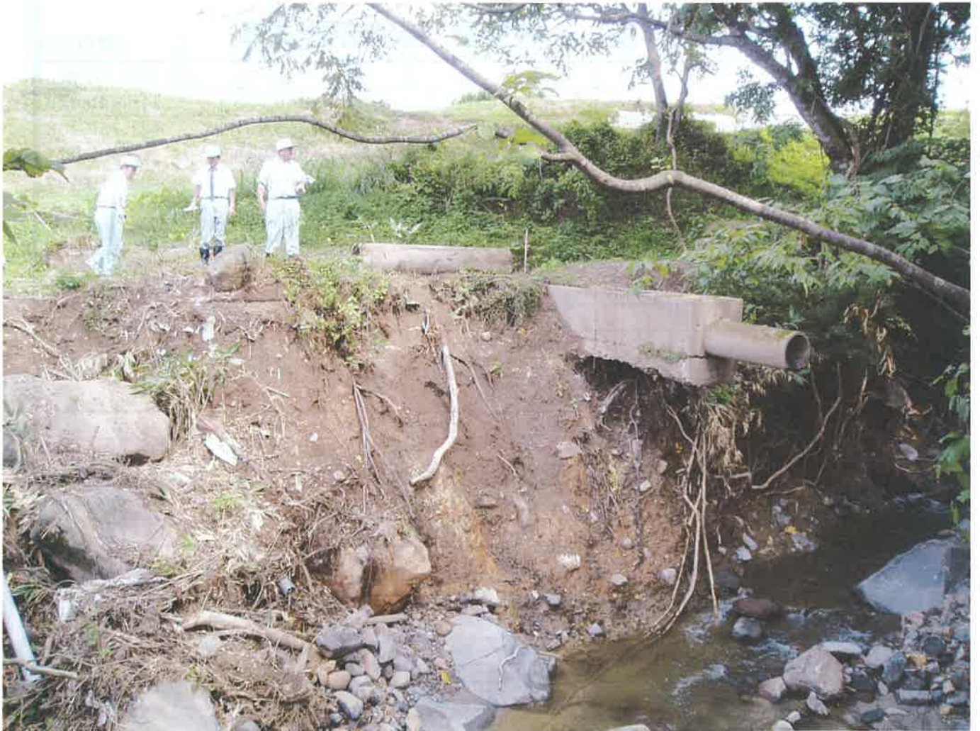
8月豪雨災害の現場調査（横岡地内）