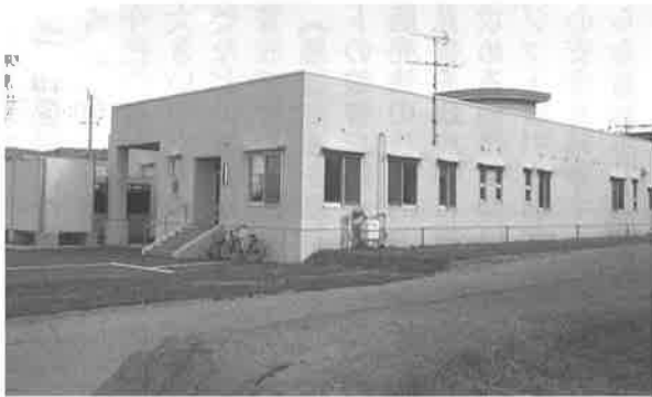
▲ 象潟学校給食共同調理場