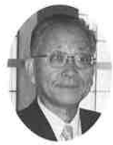
志 議員 佐々木 弘