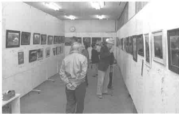
▲ 市民文化祭のようす

市長 にかほ市を全国にPRできる大きなイベントです。観光振興の一環としてホームページや報告など積極的に宣伝活動を支援しながら来年に掛けて議論をしてまいりたいと思えます。