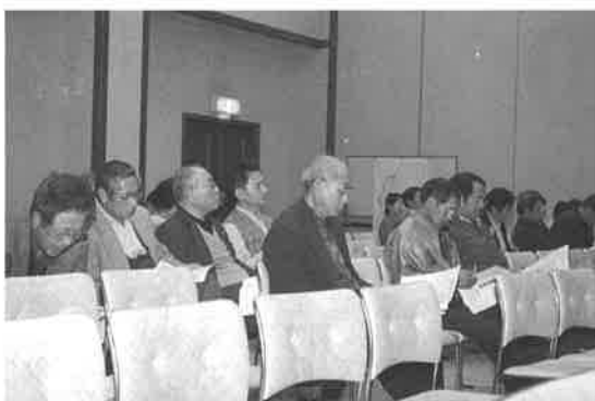
▲ 市政説明会のようす