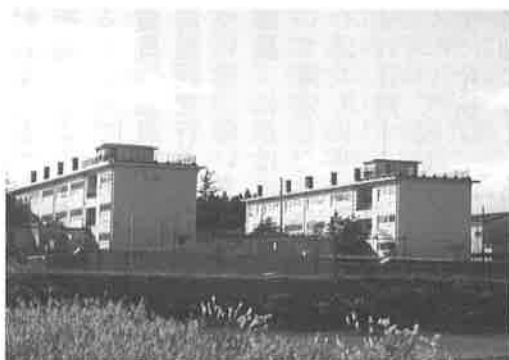
▲ 建替えが予定されている仁賀保中学校