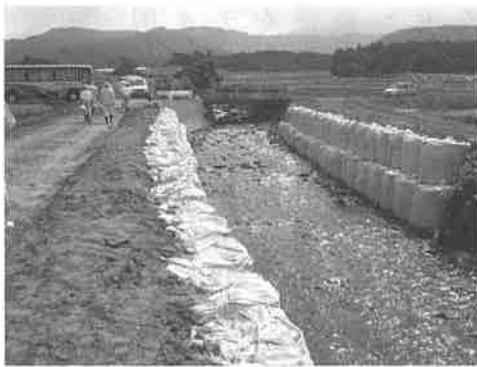
▲ 8月豪雨災害による護岸の仮復旧

市長 二十一日の午前十時に朝から降った雨は107ミリに達し市内各地で道路の冠水、床下浸水などの被害がありました。翌二十二日には、大雨警報も発表され災害発生危険性があるという判断から市災害警戒対策本部を設置しました。その後被害報告が相当発生する恐れからにかほ市災害対策本部に切り替え、災害の情報収集と応急対策に職員を総動員して対応したところであります。