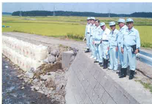
▲ 8月豪雨災害の現場調査