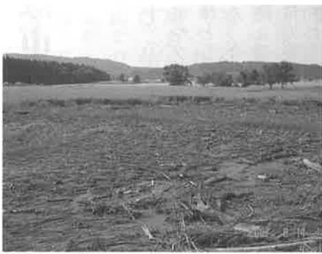
▲ 8月豪雨災害により冠水したほ場

市長 市内には減農薬、減化学肥料栽培に取り組む方々がいます。市では、水田農業ビジョンの中で特色のある米づくりに対しての支援を位置づけ、有機農業の様々な課題を克服するとともに、高品質・良食米の産地化に重点を置いています。