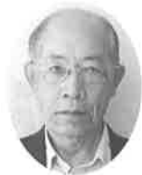
村上 次郎 議員

質問 消費税を10%にしたら市民の負担増や暮らしはどのようなになり、商店、中小業者に、どんな影響が出ると考えられますか。