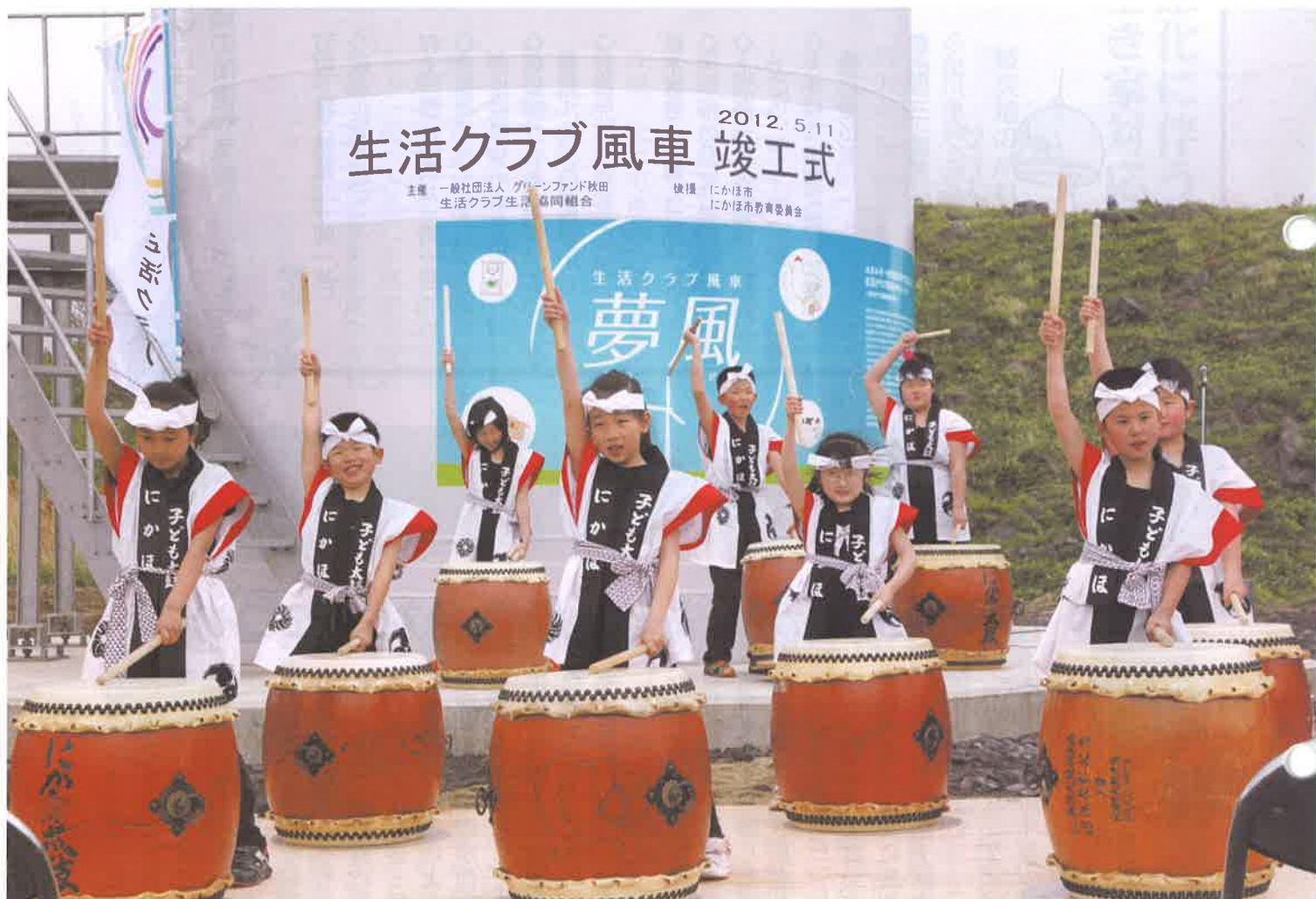
生活クラブ風車竣工式 (H24. 5. 11)