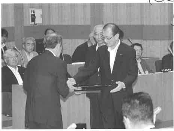
菊地 衛 議員