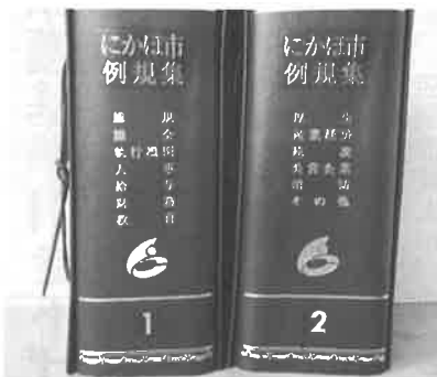
▲市の例規集。市長、副市長の給与、議員報酬が定められています

総務部長 県内他市と比べ、あるいは全国類似団体と比べて、額が低いので上げるべきと、地域経済状況を見ると上げるべきではないといった意見があり、集約を見ることができませんでした。ただ政務調査費については月額1万円が適当であるという判断が示されております。