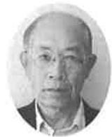
村上 次郎 議員