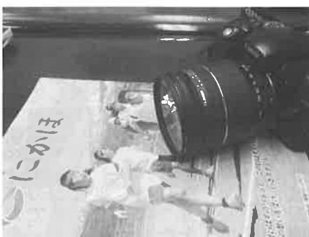
▲市の広報紙。広報モニター制を導入している

今後 はフェイスブックとかツイッターとか、こういうことも今、実現に向けて取り組みをしていきたいと思っております。すべて含めて組織全体の中で戦略を立てていくか、大きな課題として取り組むたいと思っております。