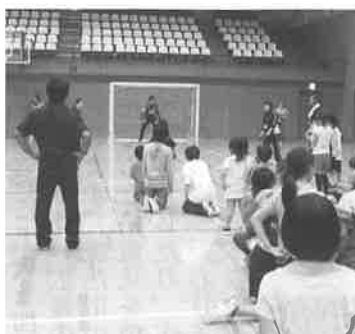
▲スポーツ推進員、ブラウブリッツ選手指導のもと、PK対決

地域力を高めるためには、地域の皆様方の創意と工夫により、主体的に取り組む地域活動が必要であり、行政として一定の助成をし、地域力を図ってくださいます。地域の一員として参画させてほしいと話をしておりま