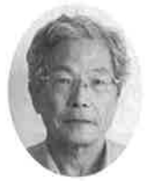
奥山 収三 議員