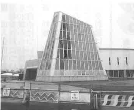
▲火災鎮火後、フェンスで立入り禁止の措置が取られた