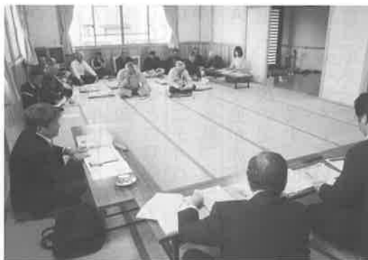
▲ 堺自治会館での報告会

※全てのご意見を掲載できませんでしたが、議会事務局にて全てのご意見、ご提案をご覧いただけます。また、市等から回答を得た事項については改めて議会だよりにて報告いたします。