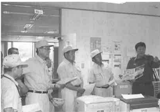
▲消防指令センターを視察

議案第61号 高機能消防司令センター整備工事請負契約の締結については、高機能消防司令センターを導入しますと、