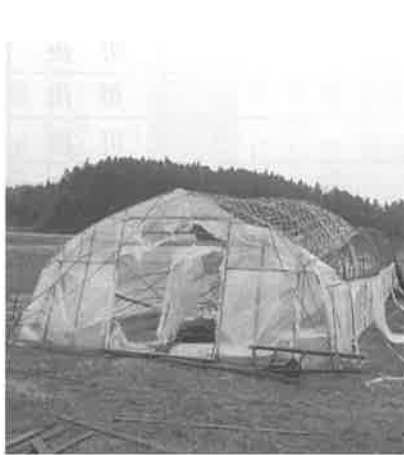
▲強風被害で損壊したビニールハウス（農業生産施設復旧支援事業補助金）

※最終日に追加提案された「平成25年度にかほ市一般会計補正予算（第3号）都市対抗野球応援ツアー関連予算」は、委員会に付託せずに本会議で可決しました。