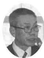
竹内 賢員 議員