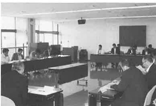
▲ 調査結果について説明を受ける(6月20日)

新しいごみ処理施設は、現在稼働中のごみ処理施設（金浦字背長森）の老朽化を受けて計画されたもので、現施設維持のため、毎年一億円以上の修繕費用が支出されています。