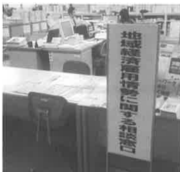
▲市の企業誘致、雇用対策窓口(金浦庁舎内 商工課)

この二社については、空き工場に入りたいという取り組みをしているところがございます。