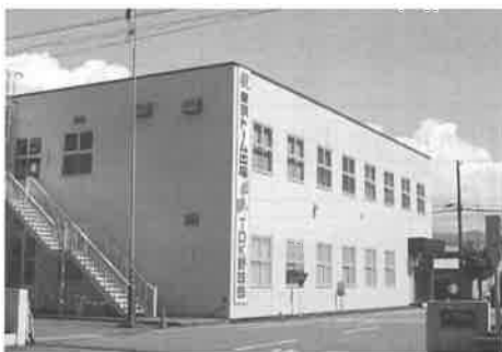
▲ TDK株式会社象潟工場