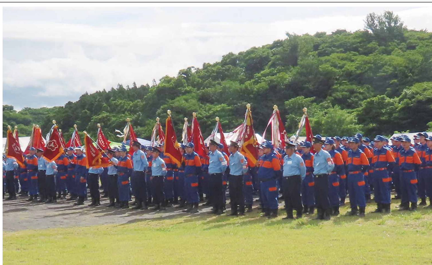
7月9日 にかほ市消防訓練大会 開会式

市民や来賓が観覧する消防訓練大会が4年ぶりに開催され、市民の生命・財産を守る消防団の訓練の成果が披露されました。