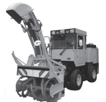
小型ロータリー除雪車

●議提第4号 可決 地方財政の充実・強化を求める意見書（陳情第7号） 審査概要 公共サービスの充実のために、基盤となる地方財政の強化を求めるもの。願意妥当として、陳情は採択と決した。 ●議提第5号 可決 ゆたかな学びの実現及び教職員定数改善並びに義務教育費国庫負担割合引き上げを求める意見書（陳情第9号） 審査概要 子どもたちの教育環境改善と教員の働き方改革など推進のために、教職員の待遇改善と財政措置を求めるもの。願意妥当として、陳情は採択と決した。 ●陳情第8号 不採択 全国霊感商法対策弁護士連絡会の不当な声明に対する陳情 審査概要 旧統一教会が行った霊感商法や高額献金に関する行為が違法行為として、すでに関係断絶を求める声明が出されていることから、不採択と決した。