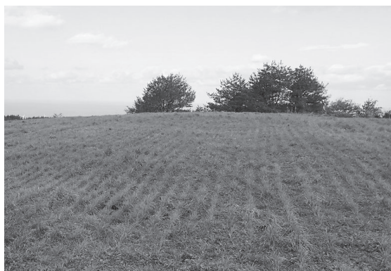
仁賀保高原の牧草地