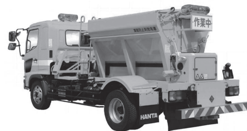
凍結防止剤散布車