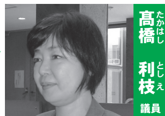
市長 高橋 利枝

※メタバース：インターネット上に構築された仮想空間 ※マッチングアプリ：恋愛や結婚等を目的とした会員同士を引き合わせるサービス