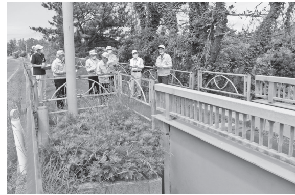
農業建設常任委員会現場踏査

大須郷こ線橋側道橋補修工事 施行に関する協定の締結 2億4295万円 概要 市道小砂川線本線の大須郷こ線橋の歩行者用側道橋を補修するため、東日本旅客鉄道株式会社との工事に係る協定の締結に、議会の議決を求めるもの。 Q 側道橋には、かなりの腐食が見られた。補修完了後、再補修が必要になるのでは。 A 現場踏査で確認した箇所以外にも、補修対象となつていて、五年ごとに点検し、その判定に合わせて対応する。